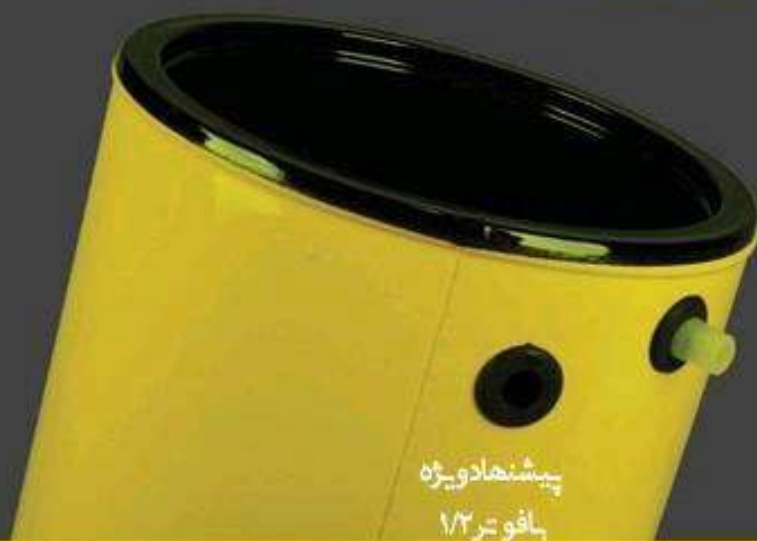
پیشنهاد ویژه با فو تر ۱/۲